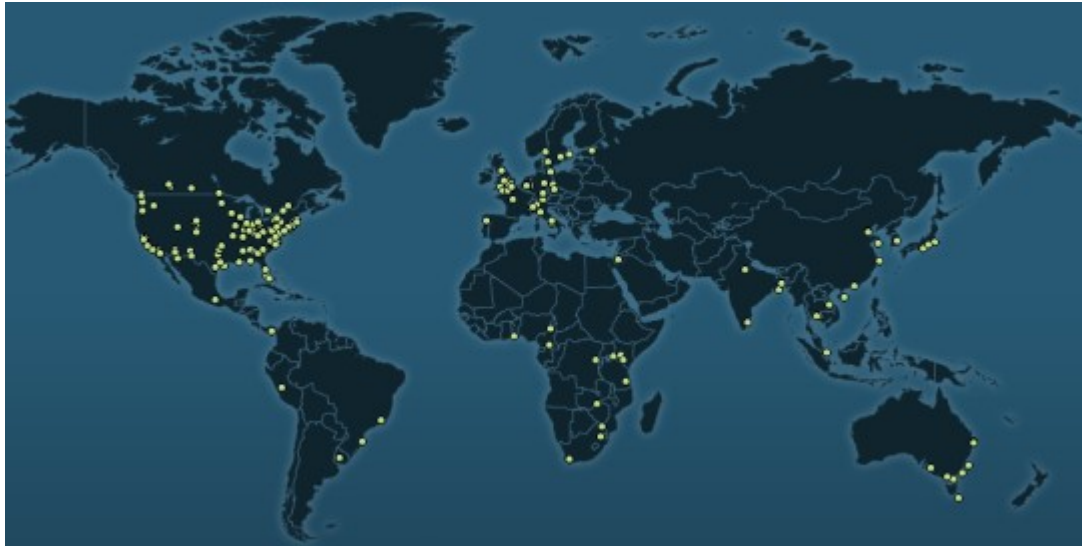
Carte des projets aidés par la fondation Melinda et Bill Gates http://www.grandchallenges.org/Pages/GrantLocations.aspx

philanthropiques 54 . En 2009, la BMGF a apporté plus de 3 milliards de dollars de subventions et 409 millions de dollars en dépenses d'exploitation, principalement destinées à des projets visant à améliorer la vie des personnes pauvres vivant dans les pays en développement. Dans le domaine de la santé publique, à part le gouvernement des États-Unis lui-même, aucun bailleur de fonds n'est aussi influent que la Fondation Gates 55 .